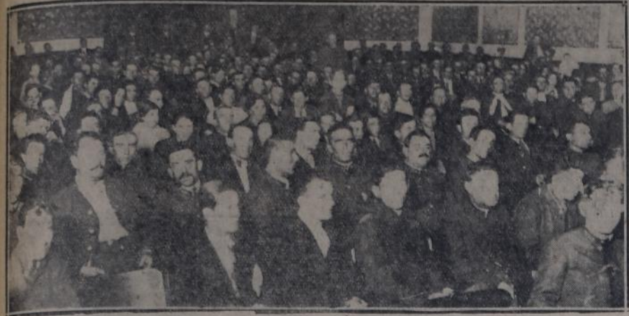
ASPECTO QUE OFRECIA EL SALON DEL CINE CANADIAN DURANTE EL ACTO DEL VIERNES DE LA "UNION TRANVIARIOS"

mará a favor del tesoro de la Unión Tranviarios tantos documentos como meses dure su representación, por el valor del sueldo a percibir en su cargo, pudiéndose proceder al cobro de los mismos al fenecer cada período mensual, en caso de incumplimiento de las cláusulas que en esta reglame-