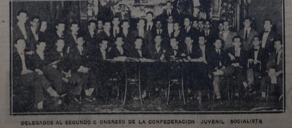
DELEGADOS AL SEGUNDO CONGRESO DE LA CONFEDERACION JUVENIL SOCIALISTA

La posesión de los mencionados antecedentes permitirá a los concejales socialistas adoptar las medidas necesarias tendientes a asegurar el cumplimiento de la ordenanza, o la derogación de la misma, en caso necesario.